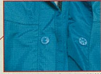
前立てレインガーター仕様