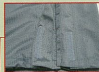
裾レインガーター仕様

ブレストックプレミアムは オンヨネが独自に新開発した 3レイヤーマテリアルです。