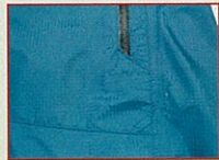
脇ポケット止水ファスナー +ポケット水抜き穴