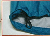
裾ドロコード調整機能付