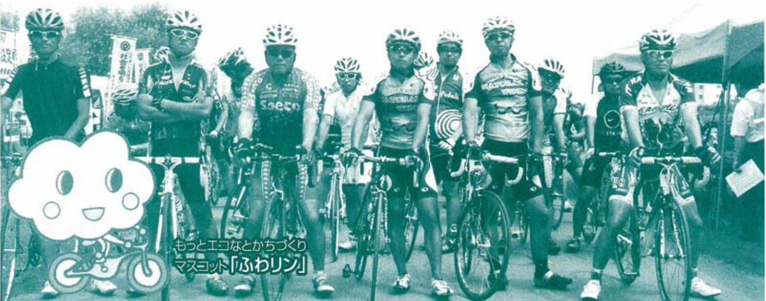
もっとエコなとかちづくり マスコット「ふわリン」